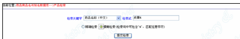
图 3.2.20.4 药品商品名的检索(例 2)

检索多种药品的商品名, 例如检索商品名为“皮康王”或者“皮康霜”的产品, 可输入“皮康%”进行模糊检索(例 2), 如图 3.2.20.4, 结果如图 3.2.20.5 所示。检索得到的 2 条产品记录如图 3.2.20.6 和 3.2.20.7 所示。