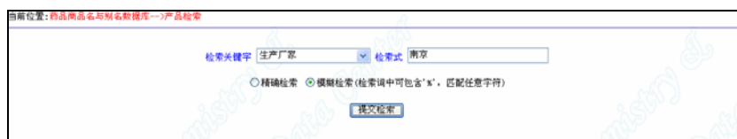
图 3.2.20.14 生产厂家检索 (例 6)

图 3.2.20.14 检索所有南京的厂家生产的药物 (例 6), 结果如图 3.2.20.15。