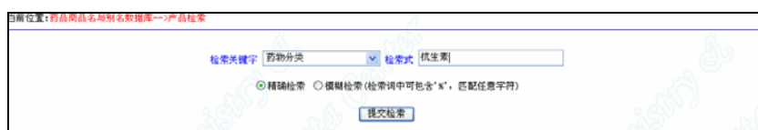
图 3.2.20.12 药物分类检索 (例 5)

检索抗生素类的药品 (例 5), 如图 3.2.20.12, 检索结果如图 3.2.20.13 所示。